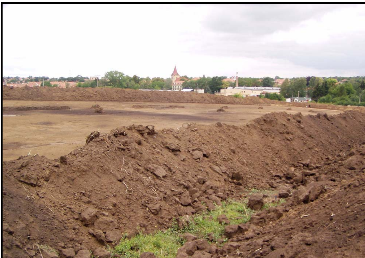
Výstavba Cedrové ulice byla zahájena skrývkou ornice a archeologickým výzkumem (tmavší místa vyznačují pravěké objekty). Snímek ze 14. července 2004

Ulici vybudovala v rámci obytného souboru Sadová I firma Central Group, a. s., která zde prodávala hotové rodinné domy s pozemky. Domy v Cedrové ulici s katalogovými čísly 66 až 72 a 75 až 82 byly nabídnuty do prodeje ve druhé etapě na jaře 2004 1 a postaveny během roku 2005.