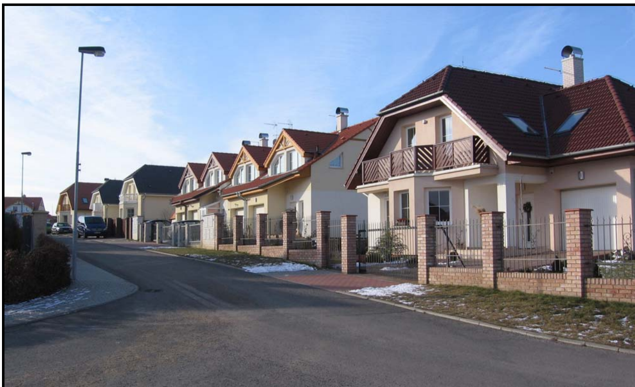
Domy na západní straně Cedrové ulice v pohledu od Jasanové ulice 15. února 2009. Zcela vpravo dům čp. 1982