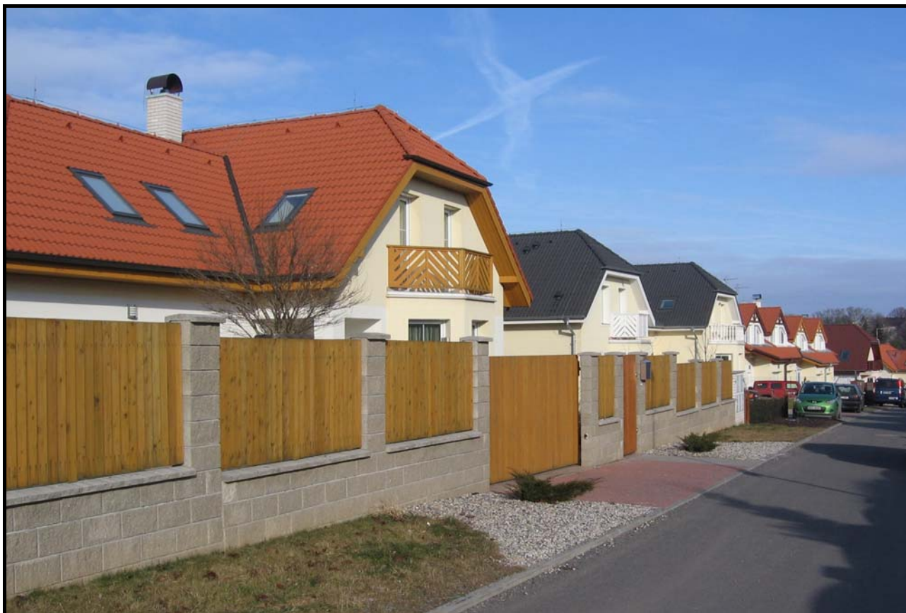
Domy čp. 1975, 1976, 1977 a další 15. února 2009