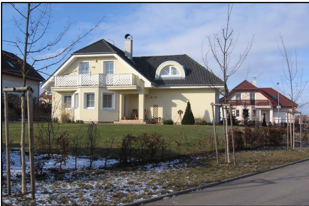
Zahradní strana domu čp. 1966 typu Imperial v pohledu z Jasanové ulice, vpravo dům čp. 1982. Snímek z 15. února 2009