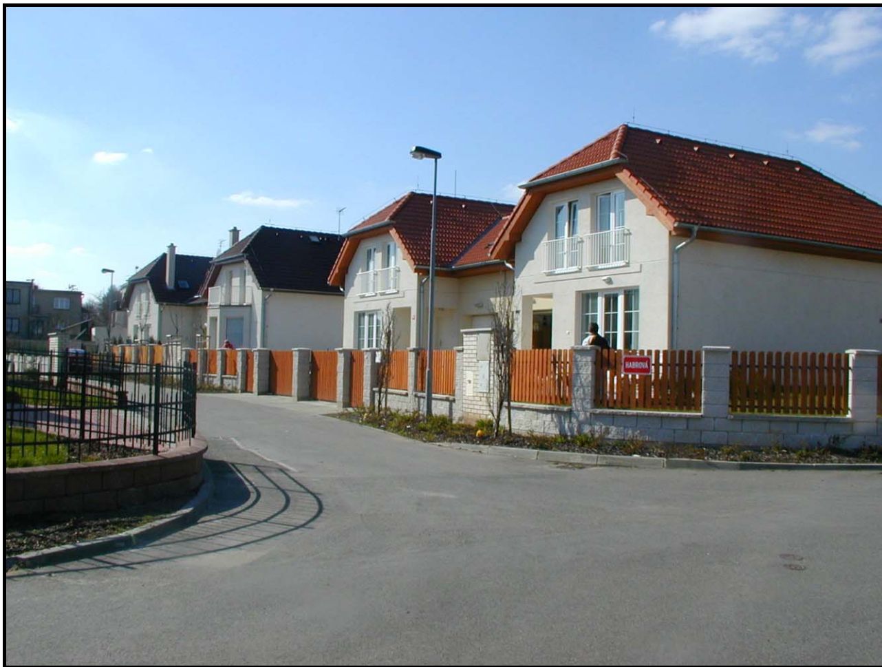
Habrová ulice s domy čp. 1850 až 1847 dne 12. dubna 2004

Ulici se všemi domy vystavěl Central Group, a. s., v letech 2001 až 2002 v rámci obytného areálu U Obory (název podle firemního katalogu je zavádějící, protože stejnojmenná ulice existuje na Břvích). 1 Byl to první projekt uvedené firmy v Hostivici.