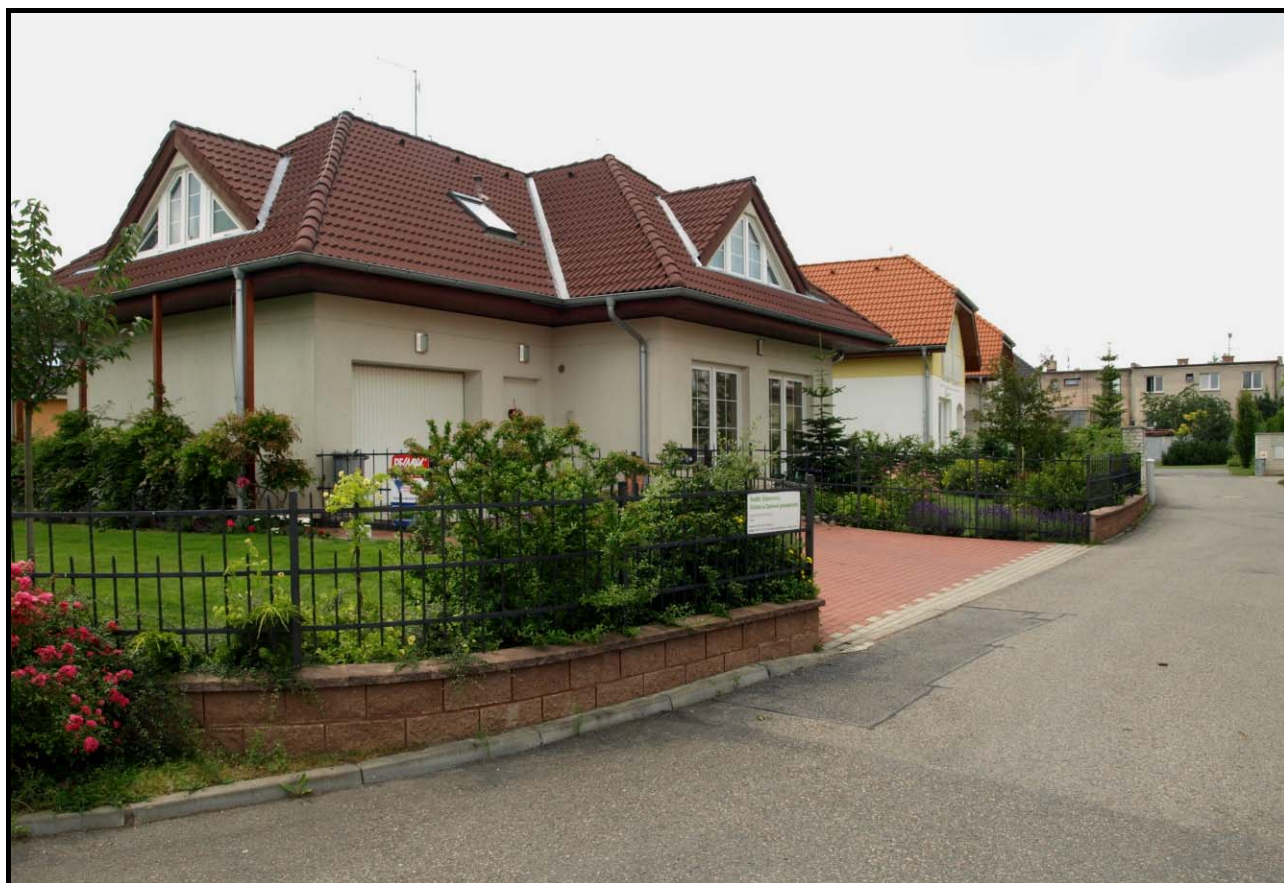
Dům čp. 1846 dne 3. července 2009.