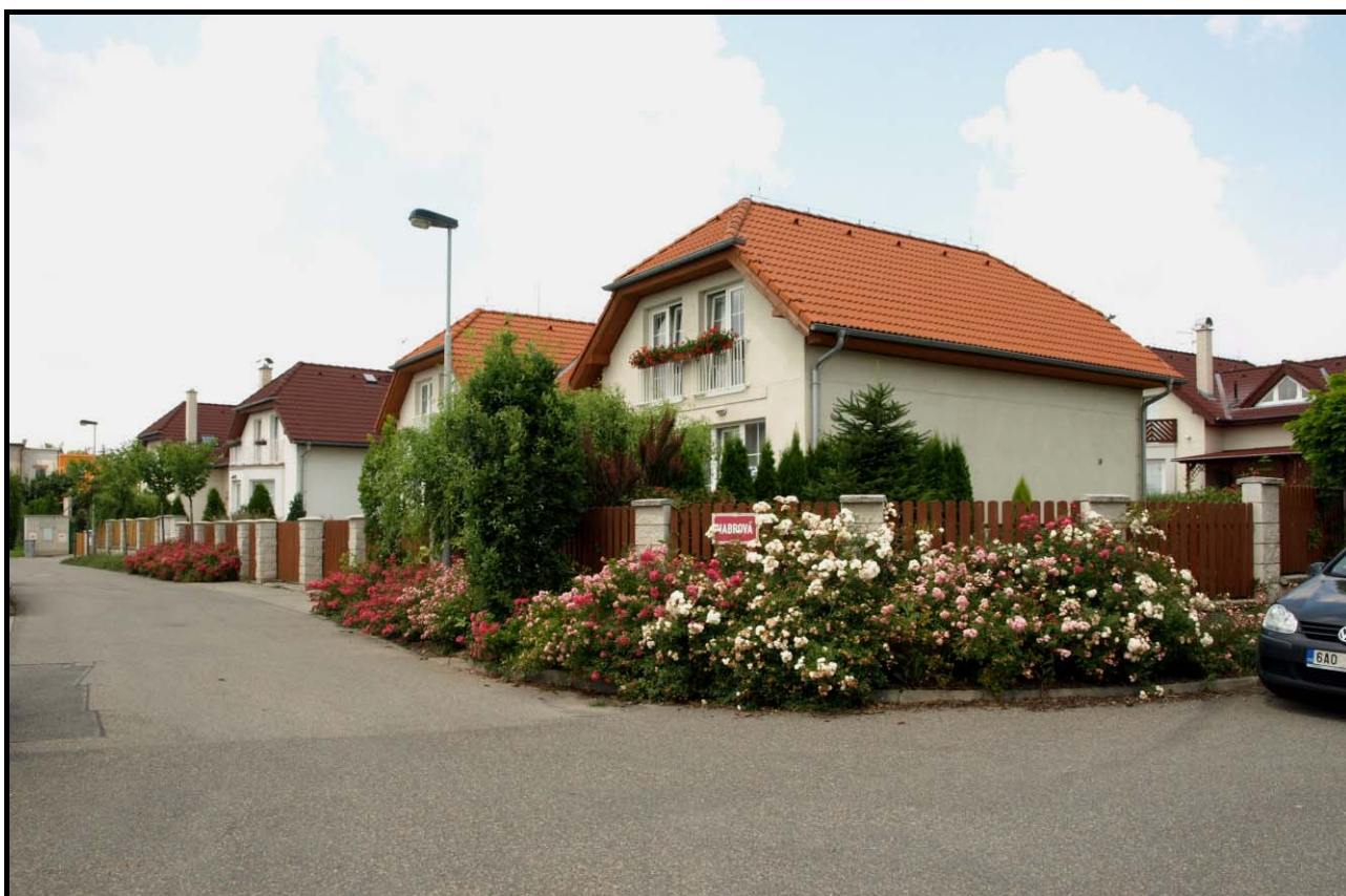
Dvojdomy čp. 1850 a 1849 (vzadu) a 1848 a 1847 (vpředu) dne 3. července 2009.