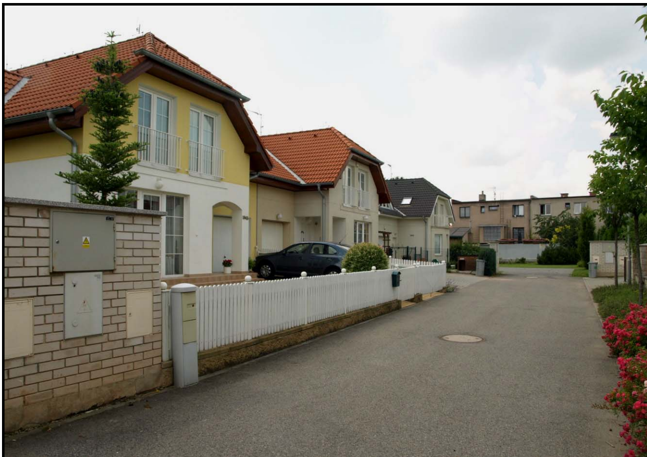
Dvojdům čp. 1845 a 1844 a dům čp. 1843 (vzadu) dne 3. července 2009.