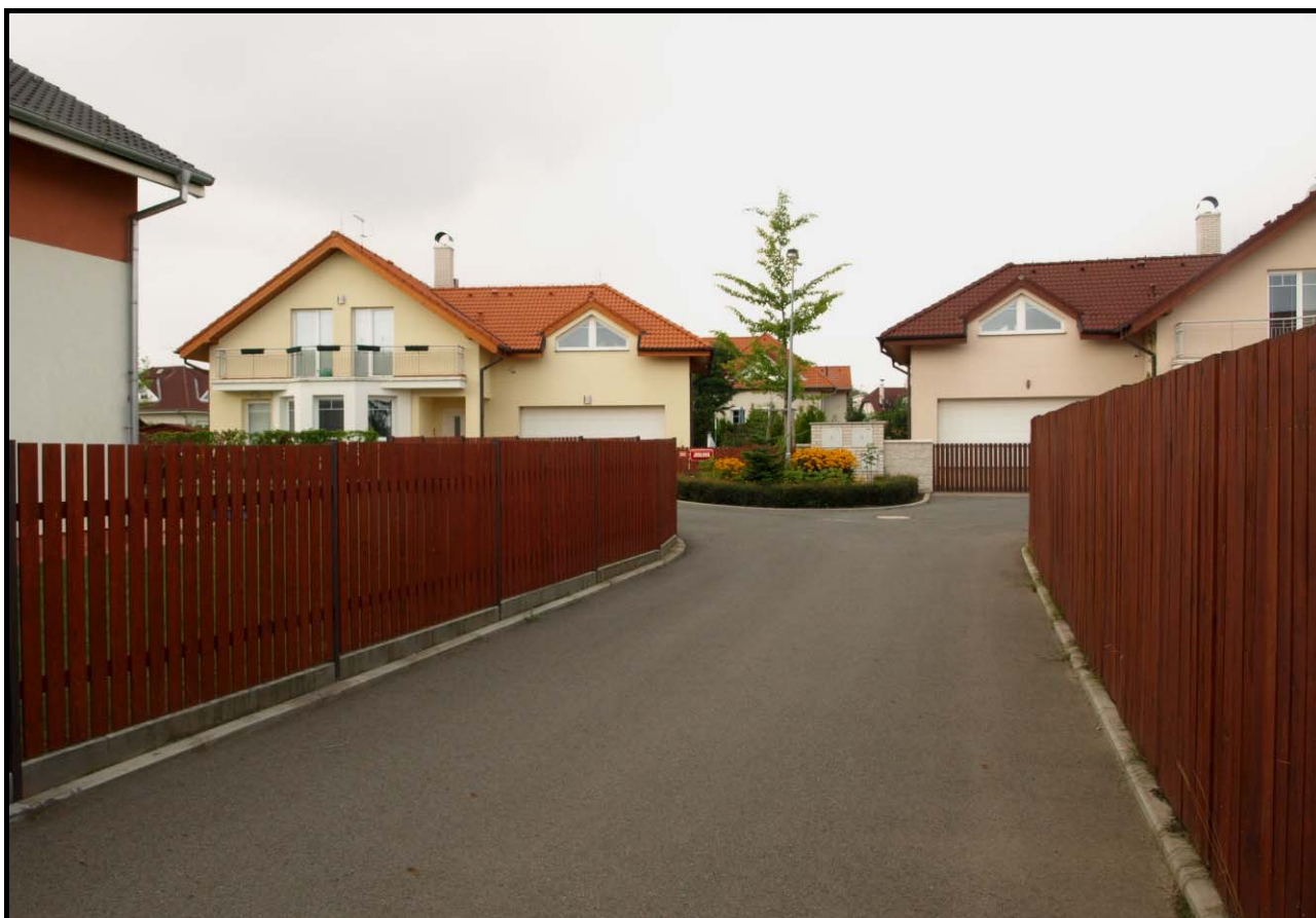
Jedlová ulice dne 18. srpna 2009.

Ulici vybudoval v rámci obytného souboru Sadová II (U Obory II) Central Group, a. s., který zde prodával hotové rodinné domy s pozemky. Výstavba inženýrských sítí a ulice byla zahájena v roce 2004. Domy v Jedlové ulici s katalogovými čísly 8 a 9 byly nabídnuty do prodeje ve první etapě v zimě 2004/2005 a dokončeny během roku 2006. 1