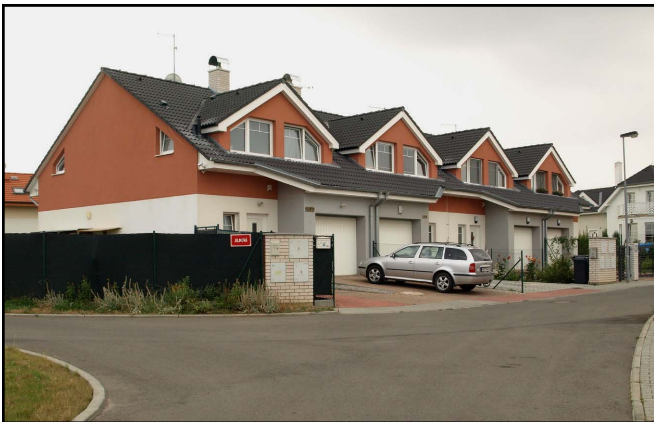
Řadové domy čp. 2032 až 2029 dne 18. srpna 2009.