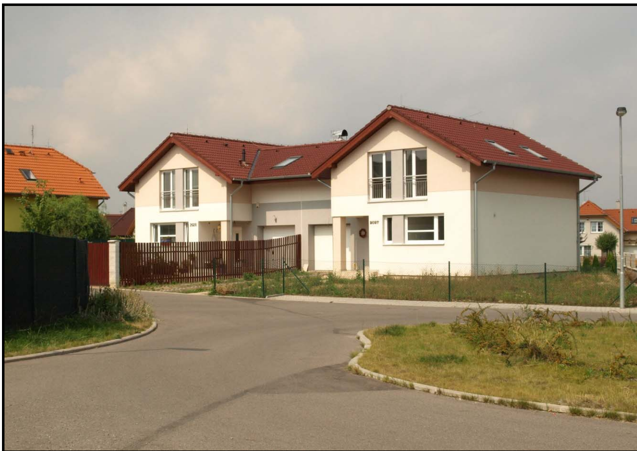
Dvojdům čp. 2028 a 2027 dne 18. srpna 2009.

Všechny ulice v lokalitě firmy Central Group Sadová II (U Obory II) pojmenovalo Zastupitelstvo města Hostivice ještě před jejich dokončením v květnu 2005 podle názvů stromů a navázalo tak na pojmenování ulic v okolí. 2