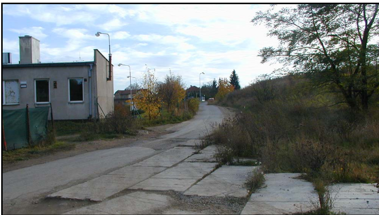
Ulice od severu 23. října 2004, před částečnou rekonstrukcí

Ulici pojmenovalo Zastupitelstva města Hostivice 25. září 2003 podle toho, že vede do oblasti ve Skále, zvané podle toho, že se zde do začátku 20. století lámal kámen v obecním lomu. 1