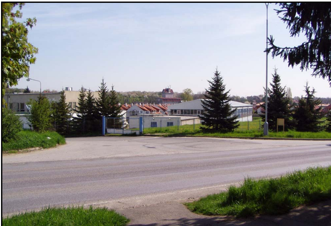
Areál DFI EUROPE přes ulici Čsl. armády 28. dubna 2008