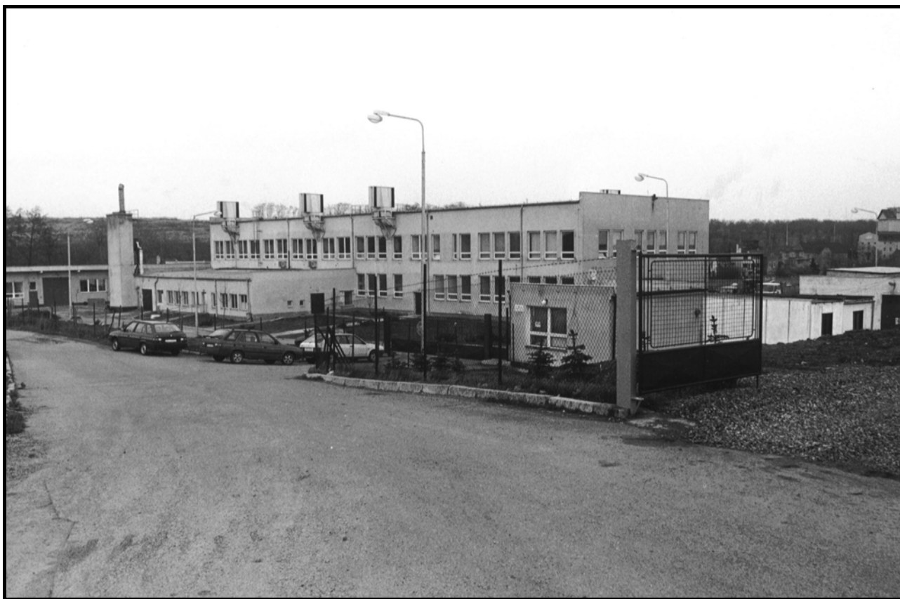
Areál Pragofolu v roce 1994.

Areál vznikl kolem roku 1990 jako předpokládané středisko Agropodniku Praha-západ. Společnost Pragofol, s. r. o., ze skupiny Chemapol Group areál přebudovala na závod zabývající se zpracováním plastů, zejména výrobou plastových fólií. Tuto výrobu zachoval i současný vlastník, společnost DFI EUROPE s.r.o., který areál koupil snad v roce 1999. Společnost patří firmě Detroit Forming, S. A., z Lucemburska.