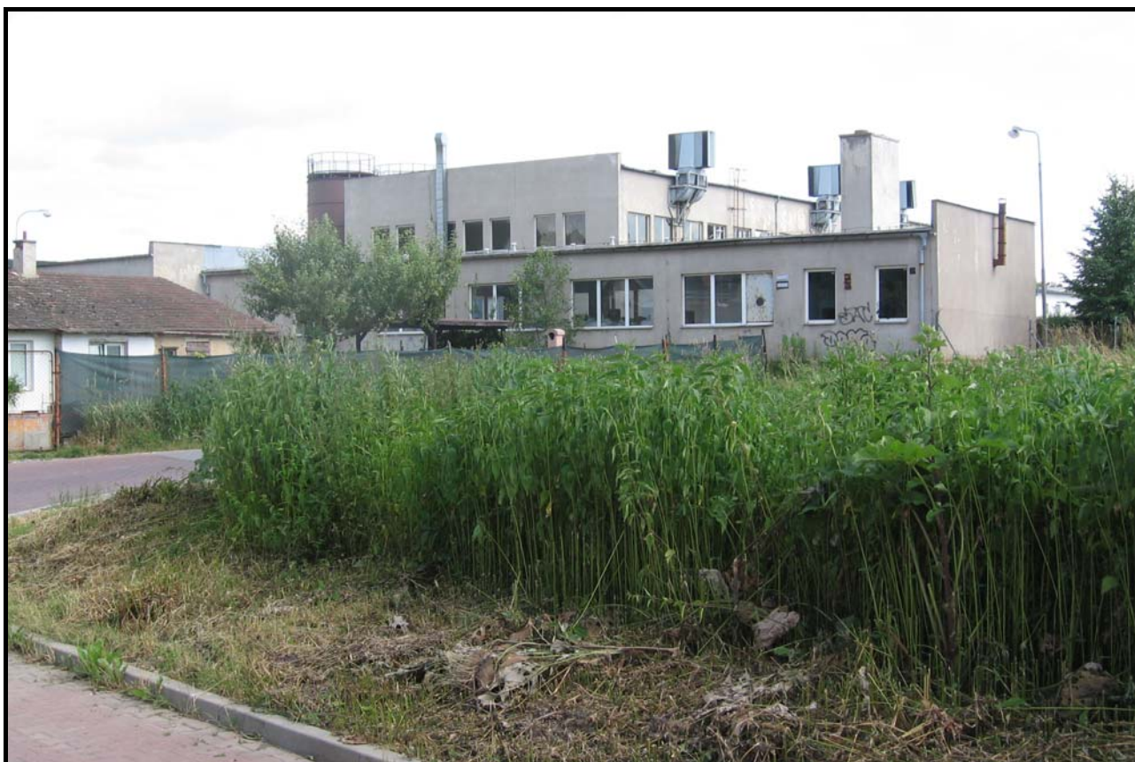
Areál DFI EUROPE z křižovatky ulic Ke Skále a Za Mlýnem 29. června 2008