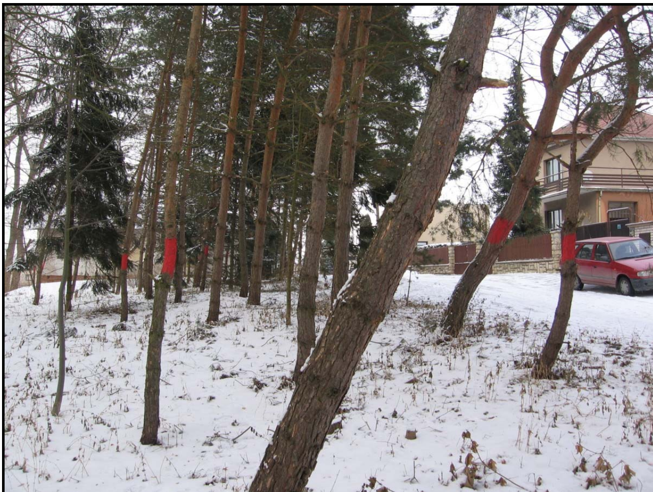
Park U Chobotu 5. února 2006