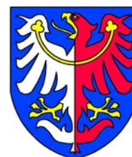
Žďárští ze Žďáru

Od roku 1702 patřily Litovice Karlu Jáchymu, hraběti z Bredy. Postupně dokázal skoupit celé okolí a vytvořil tak tachlovického panství, které zahrnovalo na 30 vesnic. Toto panství roku 1732 koupila Anna Marie Františka, velkovévodkyně Toskánská z rodu saskolauenburských. Byla posedlá stavební činností, významně proměnila hostivické náměstí řadou novostaveb a přestaveb, ale do historie litovické tvrze významněji nezasáhla.